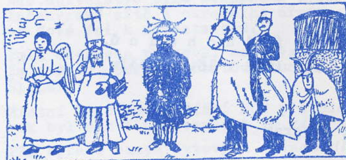
TRADIČNÍ MIKULÁŠSKÝ PRŮVOD

NARODIL SE v lykujákém městě Pataře kolem roku 250 v rodině zbožných křesťanů, již jako mladík přijal nižší duchovní svěcení. Po smrti rodičů rozdal část majetku chudým. Legenda vypráví, že se v té době dostal jistý muž do takových dluhů, že mu zbývalo jediné - prodat své tři dcery do nevěstince. Když se o tom dozvěděl sv. Mikuláš, vrazil