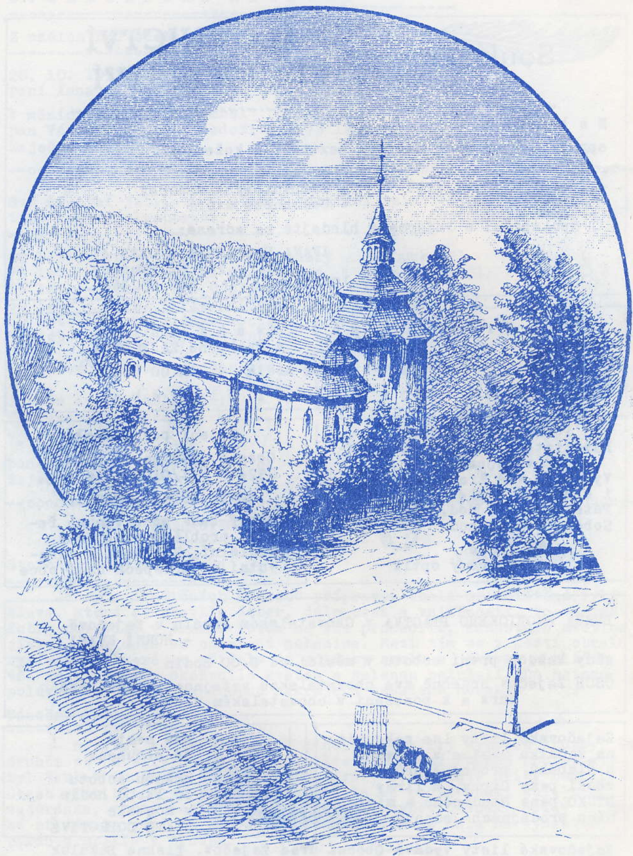
Kostelík v Mrtníku a zázračná studánka.